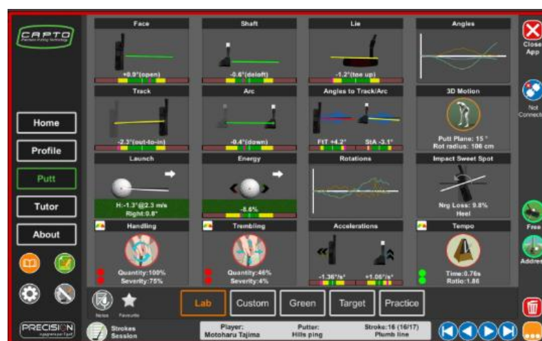
16項目のデータを見ることができます