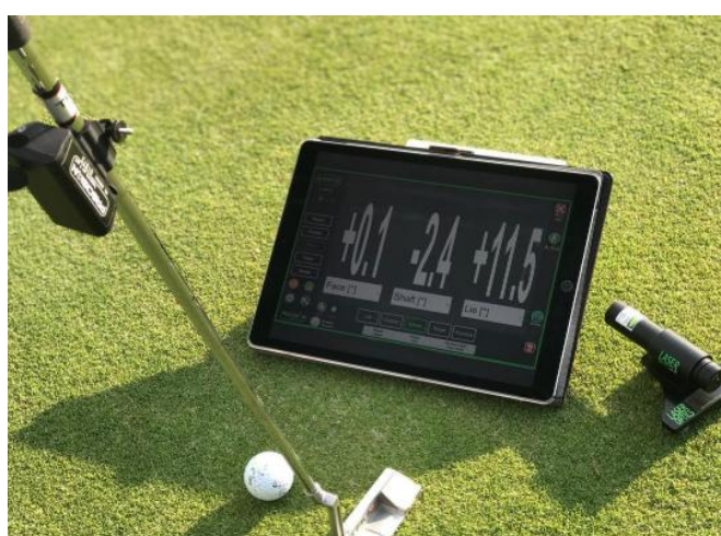
リアルタイムでフィードバック

パッティング解析センサー【CAPTO】を使用したプライベートパッティングレッスン スコアの40%を占めるといわれているパッティングに特化したマンツーマンレッスン。 実際のデータと感覚の擦り合わせ、良い部分と良くない部分を明確にし、 ピンポイントで修正をおこなえ、さらに日頃の練習内容も充実してきます。